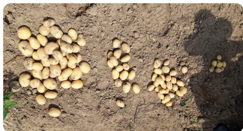
Bonitur: Hohe Ertragsanteile im gewünschten Sortierungsbereich bei hoher Qualität.